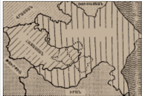
Գորելի առաջարկած դիվանը

Բարբու: Ասաց՝ ինձ մնան ճանապարհի կառուցման մասին տեղեկություններ հայտնի չեն: Ասացի՝ տարօրինակ է, որ գլխավոր շտաբի պետը տեղյակ չէ, երբ ճանապարհը կառուցվում է»: