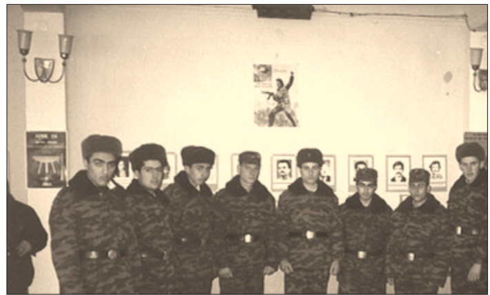
Հայաստանի Հանրապետության բանակի զինվորները Ցուցահանդեսի սրահում

ժողովրդի համար: Հասանելի էին միայն ՊԱԿ-ի (KGB) որոշ աշխատակիցներին: Հայաստանի անկախությունից հետո, չզիտես ինչու, մեր պատմաբանները համարձակություն չունեցան այդ փակ էջերը բացելու, կատարվածը վերլուծելու, ասելու՝ հանուն ինչի է այդ ամենը