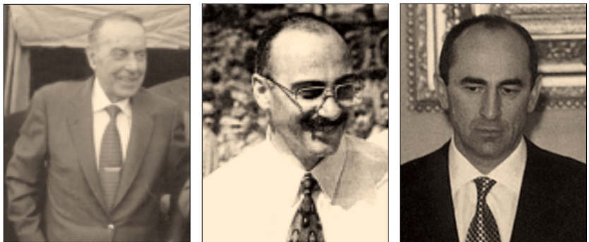
Հեյդար Ալիև Արկաղի Ղուկասյան Ռոբերտ Քոչարյան

Ադրբեջանի նախագահ Հեյդար Ալիեյը հայտարարել է, թե Ադրբեջանը պատրաստ է ռազմական ճանապարհով ազատագրել Հայաստանի կողմից բռնազավթված տարածքները: «Փրայմ նյուզը» տեղեկացնում է, որ Նովրուզի տոնի կապակցությամբ դիմելով ադրբեջանցիներին՝ Ալիեյը նշել է, որ առայժմ հուսով է, որ հայ-ադրբեջանական հակամարտությունը կկարգավորվի խաղաղ ճանապարհով: