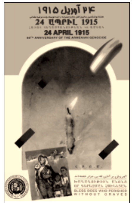
ՀԲԸՄ-ի կողմից Մեծ Եղեռնի 86-ամյակին նվիրված որմագրը:

Նա իր խոսքերում անդրադարձավ այն վնասների մասին որ ցեղաստամության անորոճ ճանաչումը կարող է հասցնել հայկական դասակարգմանը: Նա լուրջեց, որ ցեղաստամության ճանաչումը առանց հայ ժողովրդի ոճանահարված իրավունքների ընդունման եւ ցեղաստամի դասադասման նշանակում է համբերություն ցանկանալ եղածը չսանելու համար եւ մոռացության թաղ հայ ժողովրդի արդար դասակարգմանը: