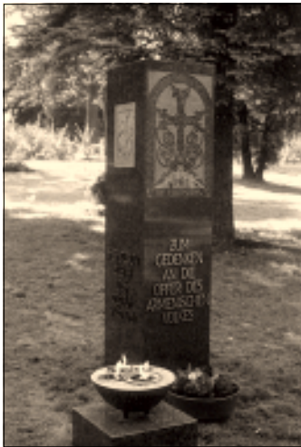
بنای یادبود شهدای قتل عام ارمنه، اشتوتگارت

در مجلس ملی آلمان (بوندستاگ) توجه به شناسائی قتل عام ارمنه رو به افزایش گذارده و اخیراً «جم اوزدمیر» از نمایندگان ترک بوندستاگ از حزب سبزهای آلمان در «سمینار بررسی مسئله ارمنی» که به همت روزنامه «پرتس آیم» تشکیل شده بود اسناد مربوط به قتل عام ارمنه در ترکیه را مورد تأیید قرار داد.